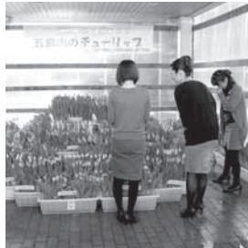
五泉園芸連が市役所玄関にチュールリップのプランターを展示中